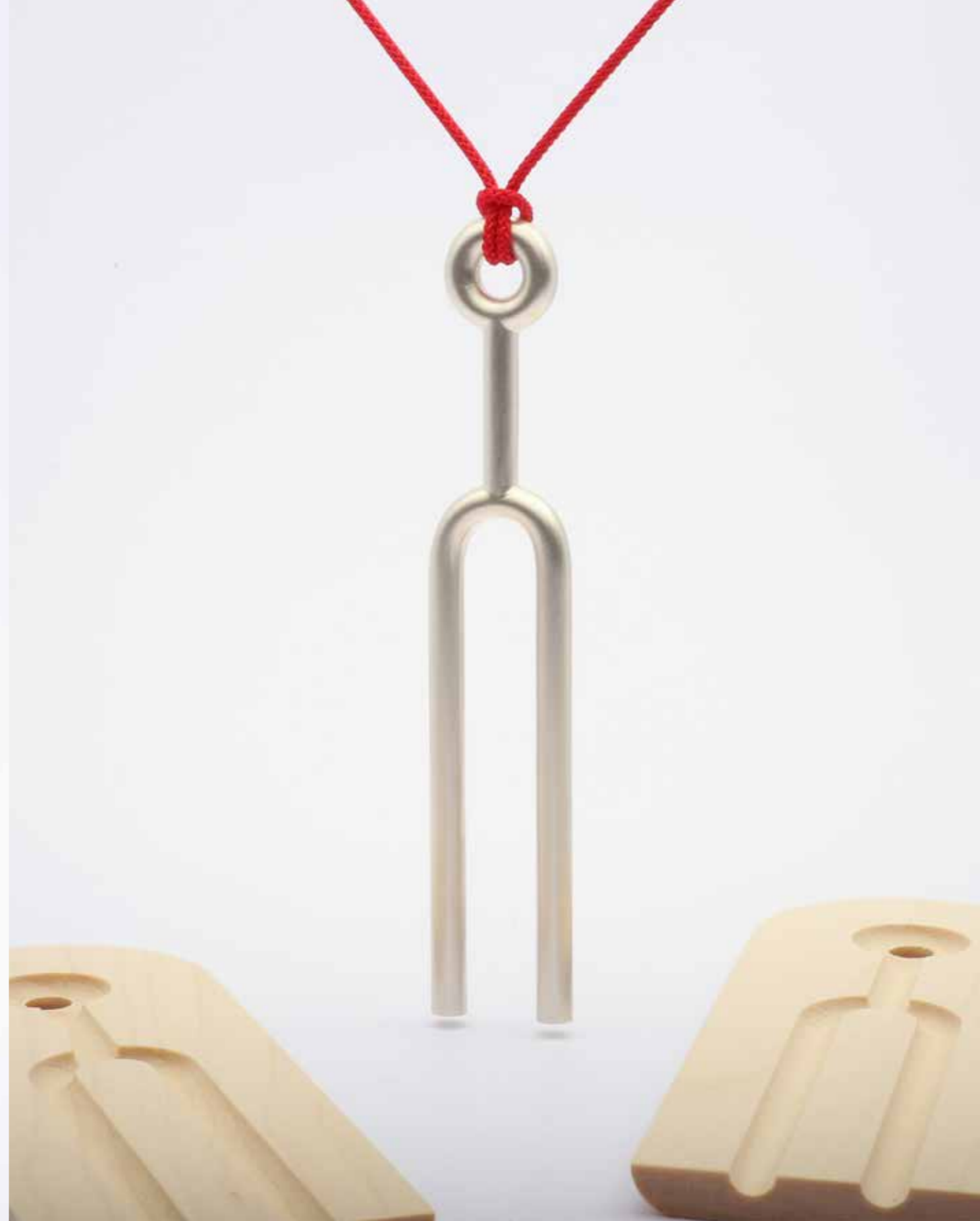
Kammertonen, sterling sølv og birketræ, 2019