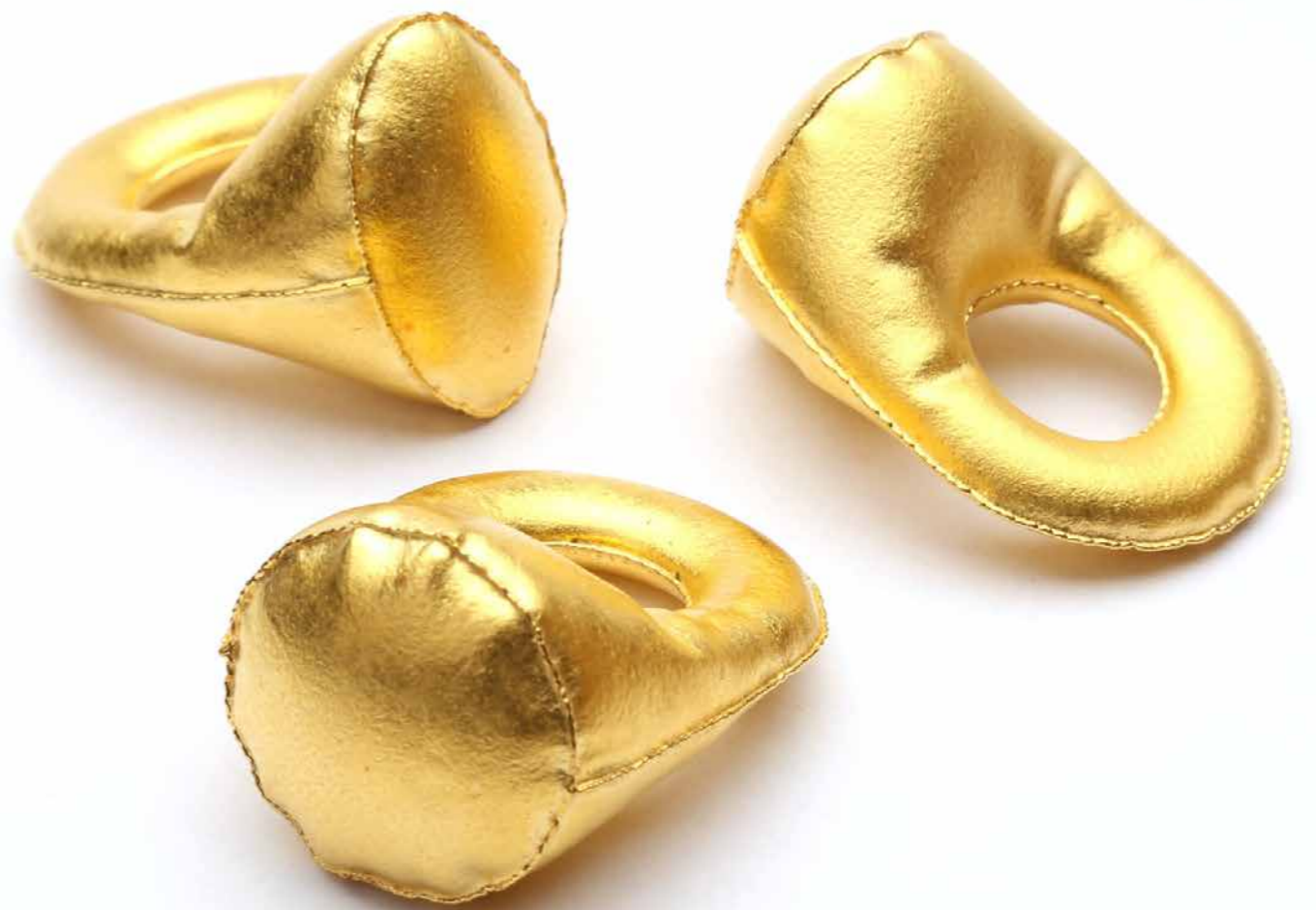
Opblæst" signetringe 9999 guld og varm luft, 2012