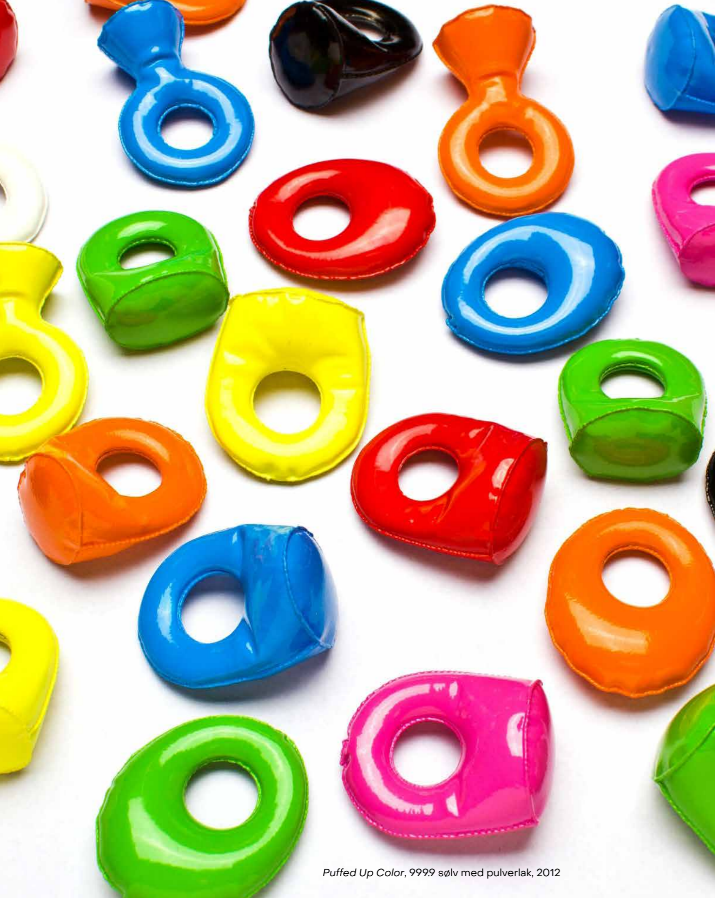
Puffed Up Color, 9999 sølv med pulverlak, 2012