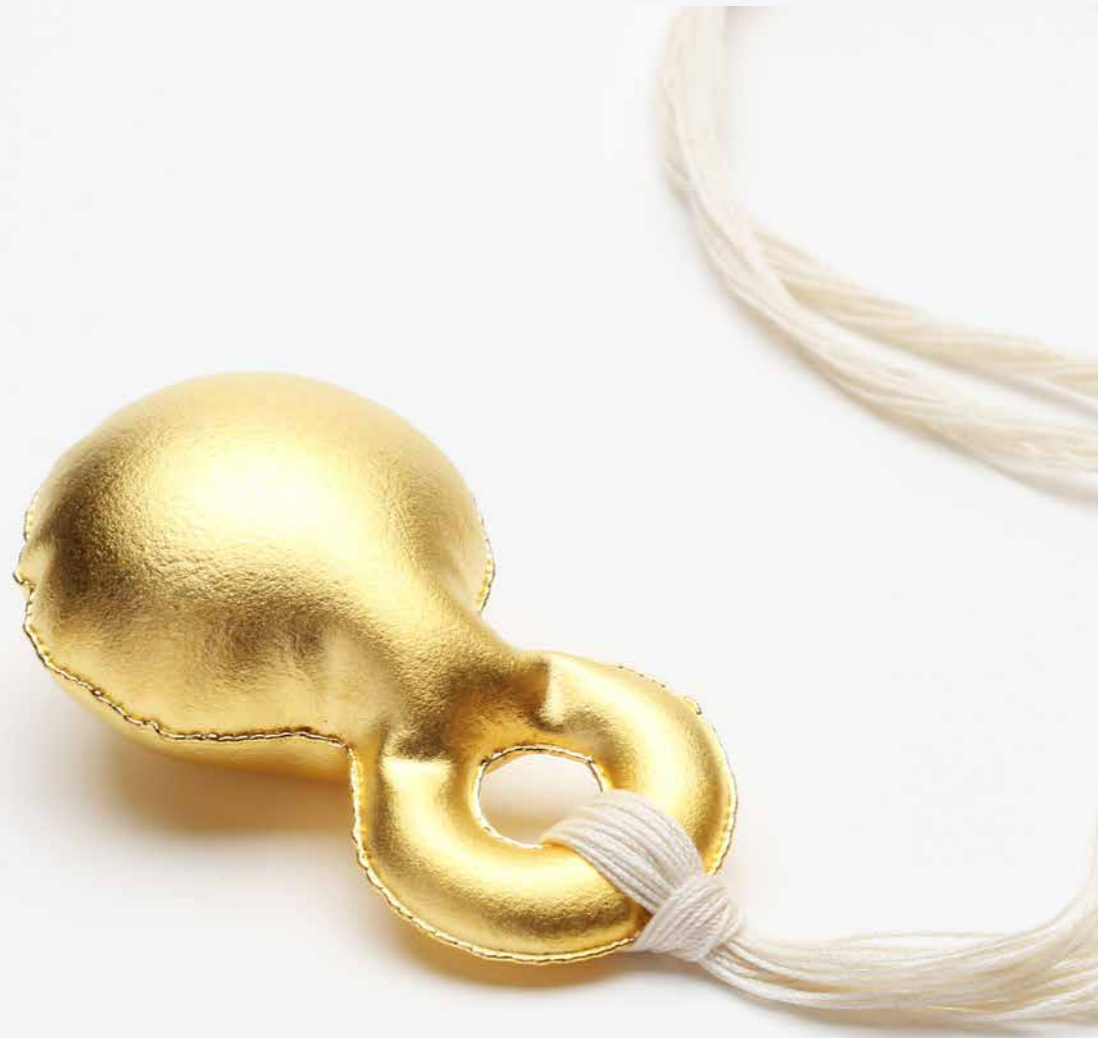
Opblæst Vedhæng, 9999 guld 2017